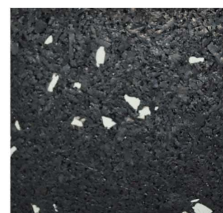
009 - Ovo | Eggshell