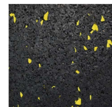
012 - Amarelo | Yellow