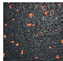
010 - Laranja | Orange