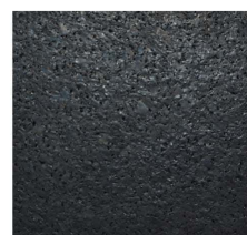
014 - Preto | Black