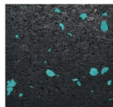
013 - Turquesa | Teal