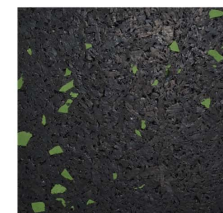
007 - Verde | Green