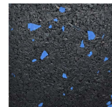
008 - Azul | Blue