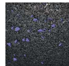
011 - Púrpura | Purple