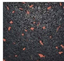
001 - Terracota