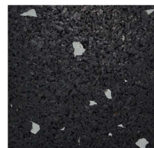
006 - Cinzento | Gray