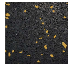
004 - Ouro | Gold