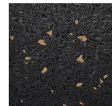
003 - Castanho | Brown