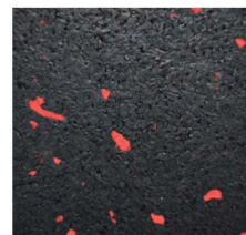
002 - Vermelho | Red